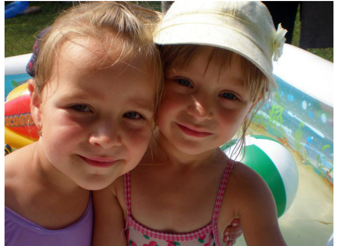
Samen op zomerkamp in 2010

Ook dit keer willen we onze sponsors en donateurs weer van harte bedanken voor hun meeleven en mee betalen van dit mooie werk in de Oekraïne. Met name de ouders en de kinderen daar zijn u er oprecht dankbaar voor!