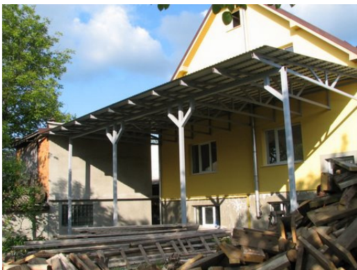
FTCH Visk uit de steigers!

Zoals ook eerder in deze nieuwsbrief is verteld, zijn er in 2010 diverse verbouwingen bij meerdere FTCH’s opgestart. Voor het uitvoeren van deze verbeteringen hebben wij een subsidie van NCDO mogen ontvangen. Dit zal waarschijnlijk de laatste maal zijn dat wij van de bestaande subsidieregelingen gebruik hebben kunnen maken; wegens beleidswijzigingen worden de bestaande subsidieregelingen afgebouwd.