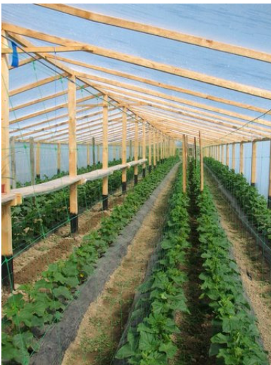
'Gurken' in de kas van FTCH Nagybereg