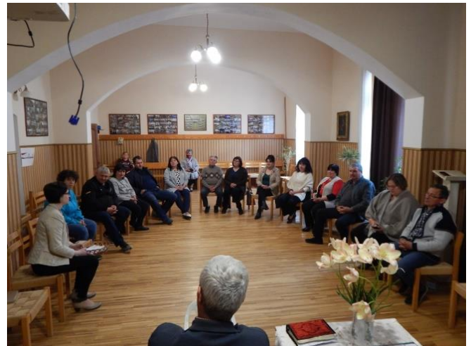
Ouders van verschillende FTCH's tijdens een seminar

Dit verschil komt voornamelijk doordat er dit jaar, binnen de corona maatregelen van de Oekraïense overheid, meer groepsactiviteiten en trainingen mogelijk waren.