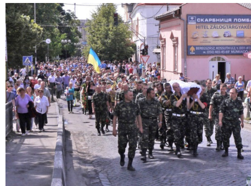
Begravenisstoet voor oorlogsslachtoffers in Beregszász